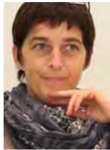
Barbara Steffens, NRW-Gesundheitsministerin

» Wir tun schon eine ganze Menge für den niedergelassenen Nachwuchs. Und im kommenden Jahr steigern wir die Zahl der Praxis-Stipendien von 60 auf 100. Die Zahlen steigen, aber das reicht nicht. Zumal die Medizin weiblich wird und die Y-Generation nachrückt. «