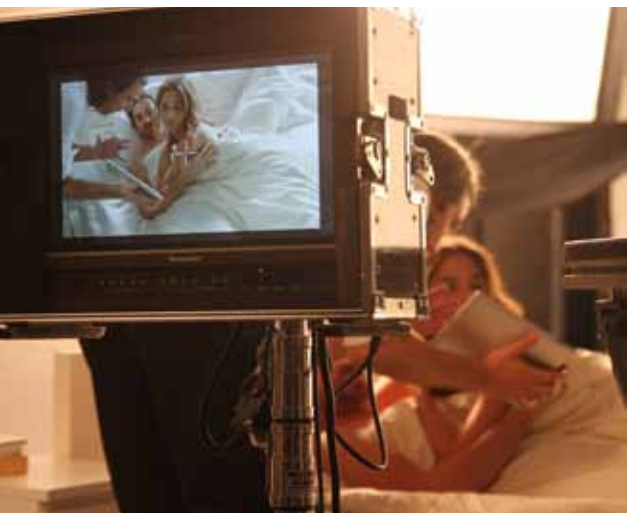
Der Kinospot der Imagekampagne wurde im Bett gedreht.

Die große zweite Werbewelle mit Plakaten und TV-Spots für die Kampagne „Wir arbeiten für Ihr Leben gern“ zeigt Wirkung: Mit 18 Prozent lag die Kampagnenwahrnehmung trotz hoher Werbekonkurrenz kurz vor der Bundestagswahl um drei Prozentpunkte höher als im Mai.