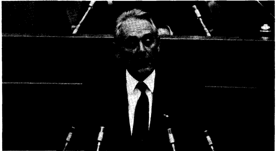
Freude, Dankbarkeit und ein Appell an die Jugend: Erster Vizepräsident Dr. Hans-Ulrich Klose zur deutschen Vereinigung.

In diesen Dank beziehen wir die politische Verantwortlichen, die im richtigen Augenblick die richtige Entscheidung getroffen haben, ein.“ An dieser Stelle wolle er um Verständnis für die Menschen bitten, für die sich die Freude über die zurückgewonnene Einheit und Freiheit unseres Vaterlandes mit der Trauer mische, die alte Heimat endgültig verloren zu haben. Er meine die Vertriebe-