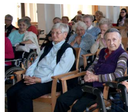
Die Bewohner des Seniorenheims genossen