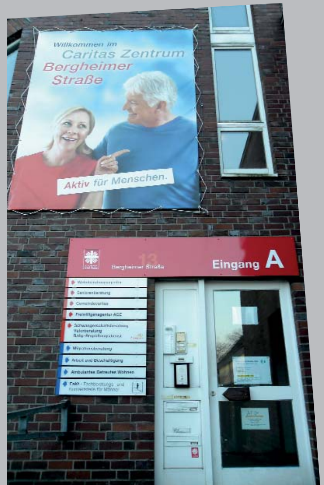
Ein zusätzlicher Eingang und eine neue Beschilderung sorgen für mehr Übersicht und erleichtern die Orientierung im „Sozialen Zentrum Alte Molkerei“.