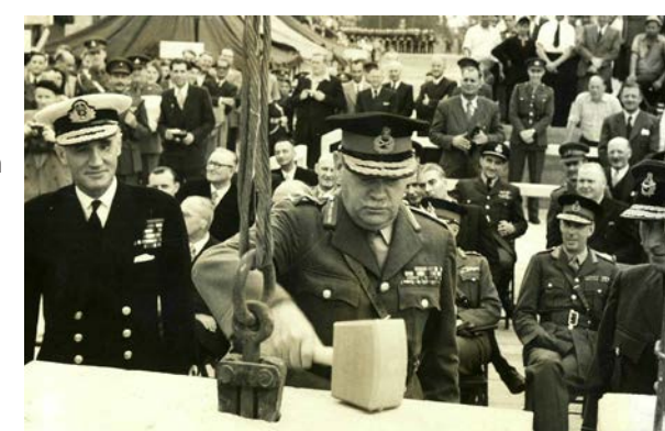
Grundsteinlegung am 1. Juli 1953 mit General Sir Richard Gale.

Am kommenden Samstag, 13. Juli, laden die Briten dann im Hauptquartier zu einem großen Tag der offenen Tür ein, frei nach dem Motto „ein bisschen party in the park.“ Die Feierlichkeiten werden am Sonntag, 14. Juli, mit einem Abschlussgottesdienst in der Kirche St. Bonifatius für geladene Gäste abgeschlossen.