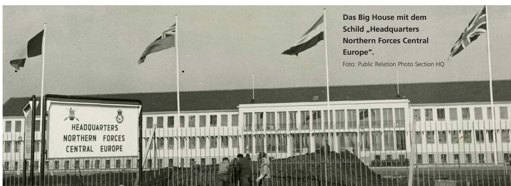
Das Big House mit dem Schild „Headquarters Northern Forces Central Europe“.

Das Joint Headquarters in Rheindahlen (JHQ) war eine Stadt für sich. Das rund 400 Hektar große Areal hatte alles zu bieten, was man zum Leben braucht. Insgesamt entstanden 1126 Wohngebäude für Soldaten und deren Angehörige sowie 100 einfachere Unterkünfte für ledige Soldaten und Zivilangestellte. Geplant wurde 1952 Wohnraum für rund 10.000 Menschen. Neben Freizeiteinrichtungen wie Kino, Theater, Freibad und über 20 Sportanlagen gab es außerdem ein Postamt, eine Schule, ein Reisebüro, einen Frisör, Supermärkte, eine Feuerwache, zwei Kirchen und zahlreichen Offiziersmessens oder Klubräume.