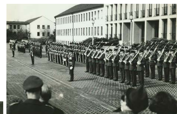
Parade und Empfang zum 18. Jahrestag der NATO im Hauptquartier.