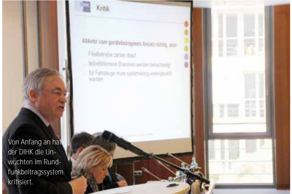
Von Anfang an hat der DIHK die Unwuchten im Rundfunkbeitragssystem kritisiert.

Berlin. In einem Schreiben an die Ministerpräsidenten der Länder fordert DIHK-Präsident Eric Schweitzer neben einer Absenkung des Rundfunkbeitrages auch die Unwuchten und Zusatzbelastungen im Bereich der Wirtschaft auszugleichen und zügig nachzubessern. Konkret geht es darum, dass Unternehmen mit mehreren Betriebsstätten einen ungleich höheren Beitrag entrichten als nach der Beschäftigtenzahl gleich große Unternehmen mit nur einem Standort. Nach Auffassung der Wirtschaft gehört auch die systemwidrige Einbeziehung von Fahrzeugen in die Bemessungsgrundlage auf den Prüfstand. Anlass für das Schreiben sind die jüngsten Berechnungen der Kommission zur Ermittlung des Finanzbedarfs der Rundfunkanstalten, wonach sich Mehreinnahmen in Milliardenhöhe abzeichnen.