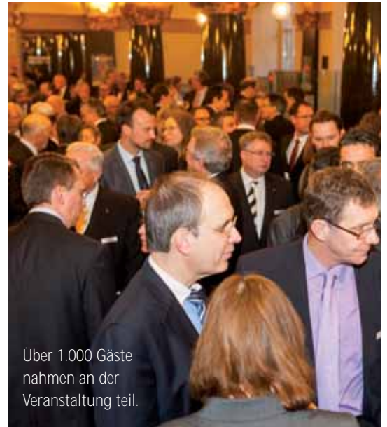
Über 1.000 Gäste nahmen an der Veranstaltung teil.