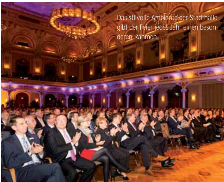
Das stilvolle Ambiente der Stadthalle gibt der Feier jedes Jahr einen beson- deren Rahmen.