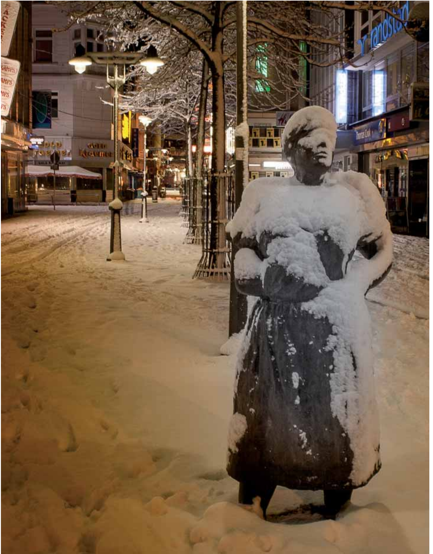
Ein seltenes Bild in diesem Winter: Die schneebedeckte Minna Knallenfalls in der Elberfelder Innenstadt.