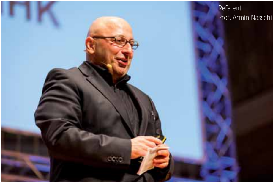
Referent Prof. Armin Nassehi