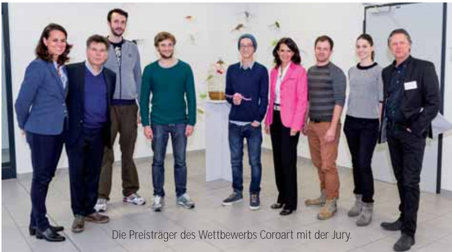
Die Preisträger des Wettbewerbs Coroart mit der Jury.