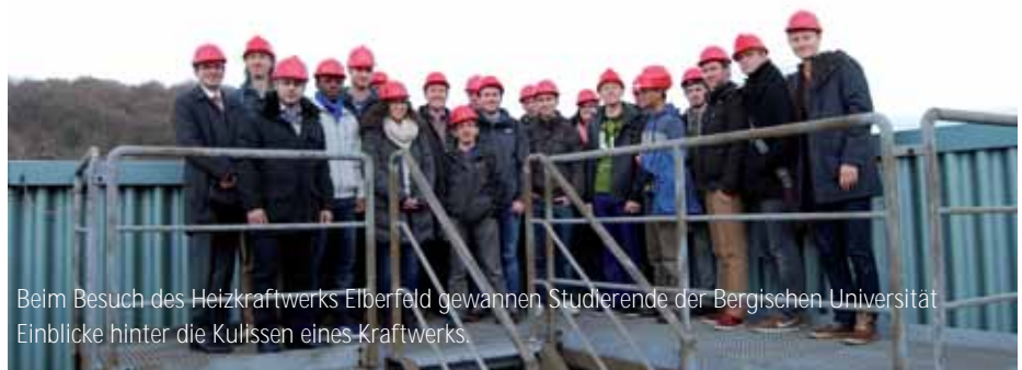
Beim Besuch des Heizkraftwerks Elberfeld gewannen Studierende der Bergischen Universität Einblicke hinter die Kulissen eines Kraftwerks.

Stadtwerke zu informieren, die vom Praktikumsangebot über betreute Abschlussarbeiten bis zum Traineeprogramm reichen.