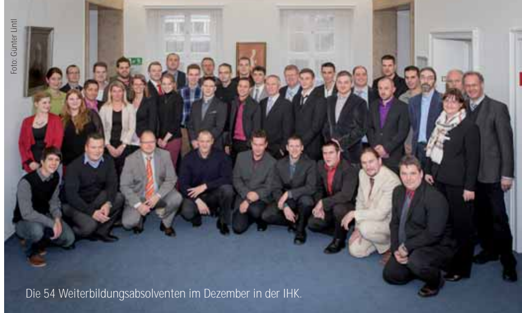
Die 54 Weiterbildungsabsolventen im Dezember in der IHK.

zwei Geprüfte Technische Betriebswirte, 12 Geprüfte Verkehrsfachwirte, drei Geprüfte Industriemeister der Fachrichtung Elektrotechnik, neun Geprüfte Industriemeister der Fachrichtung Metall, 15 Geprüfte Industriemeister der Fachrichtung Leit- und Sicherungstechnik, vier Geprüfte Konstrukteure und fünf Handelsassistenten-Einzelhandel. „Eine bestandene IHK-Prüfung soll belegen, dass man für