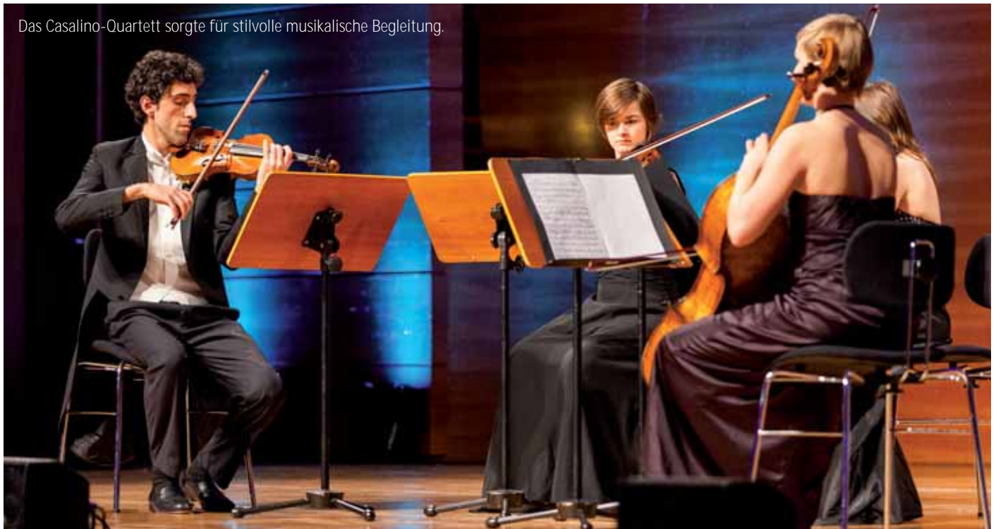
Das Casalino-Quartett sorgte für stilvolle musikalische Begleitung.