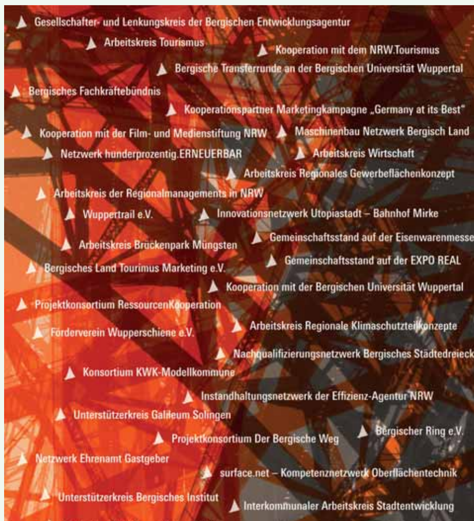
Netzwerke, Kooperationen und Partnerschaften der Bergischen Entwicklungsagentur.

Das Bergische Städtedreieck hat in den letzten Jahren eine Vielzahl unterschiedlichster Netzwerke, Kooperationen und Partnerschaften aufgebaut. Auf diese Weise konnte eine Zusammenarbeit erreicht werden, die ihresgleichen sucht. Sie hat erste, wahrnehmbare strukturelle Erfolge