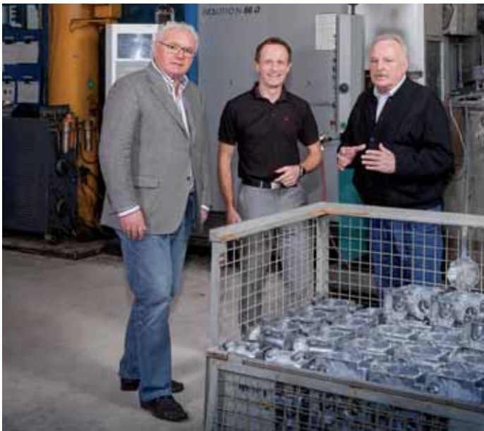
18 Druckgussteile für die Automobilbranche: Breitfort Druckguss GmbH & Co. KG