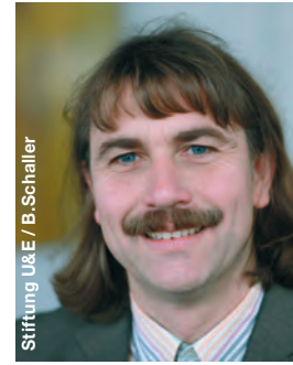
Stiftung U&E / B.Schaller

Ohnehin befindet sich die große Mehrzahl der Flüsse und Seen bei uns in keinem guten Zustand. Die intensive Landwirtschaft mit ihren Schadstoffeinträgen ist dafür ebenso verantwortlich wie viele Kommunen, die zu wenig Gewässerschutzstreifen ausweisen und bei der Entwicklung von Auen den vorsorgenden Hochwasserschutz sträflich vernachlässigen. Der NABU NRW hat daher mit dem BUND und der Landesgemein-