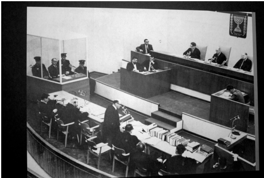
Der Prozess im Jerusalemer Bezirksgericht im Jahr 1961

Campus Delicti: Die Eichmann-Ausstellung wurde für die Topographie des Terrors in Berlin gemacht. Wer hat das Drehbuch für die Eichmann-Ausstellung geschrieben?