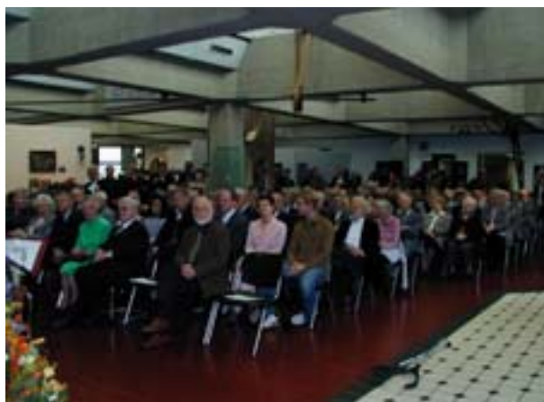
Eine volle Museums-Ausstellung während des Empfangs