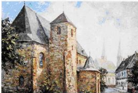
Stiftkirche in Stoppenberg. Gemälde von Wilhelm Friedrich (1858) – Privatbesitz –