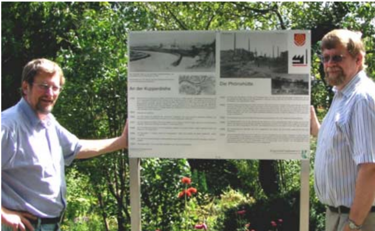
Kupferdreher Denkmalpfad eingeweiht